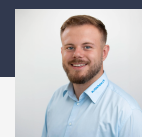
Renat Uruqi Verkauf DE, EN, SQ-AL